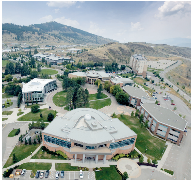
TRUキャンパスはカムループスの中心部にあります

30年以上に渡って、トンプソン・リバーズ大学（TRU）は最高水準のカスタマイズされたトレーニングプログラムを提供してきました。その甲斐あって、世界的な評価を得ています。当校の集中短期プログラムは、学ぶ機会の最大化を目標とし、戦略的にバランスを図っています。それにより、カナダ文化の認識を高めていくと同時に、選ばれた文化活動に参加できるだけの十分な時間を確保しています。それは、一生思い出に残る豊かで有意義な体験なのです。